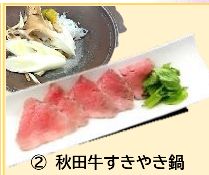
② 秋田牛すきやき鍋