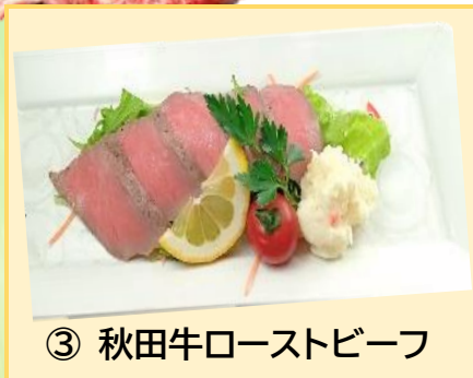
③ 秋田牛ローストビーフ